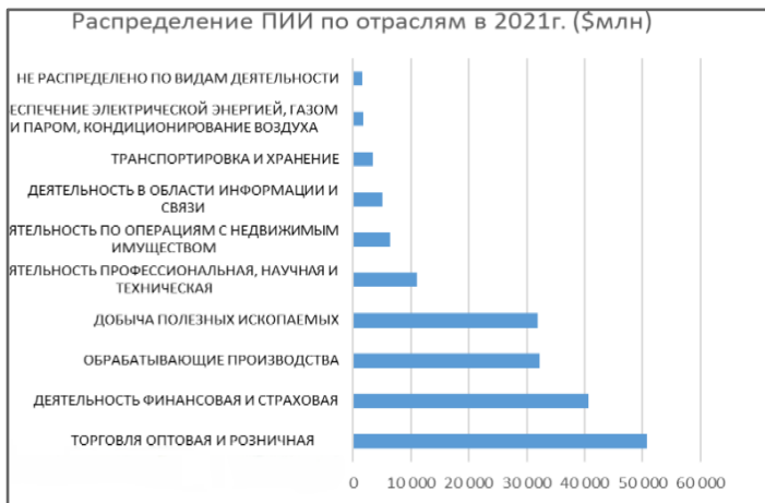
Рисунок 1. Распределение ПИИ по отраслям в 2021г. (Млн долл)