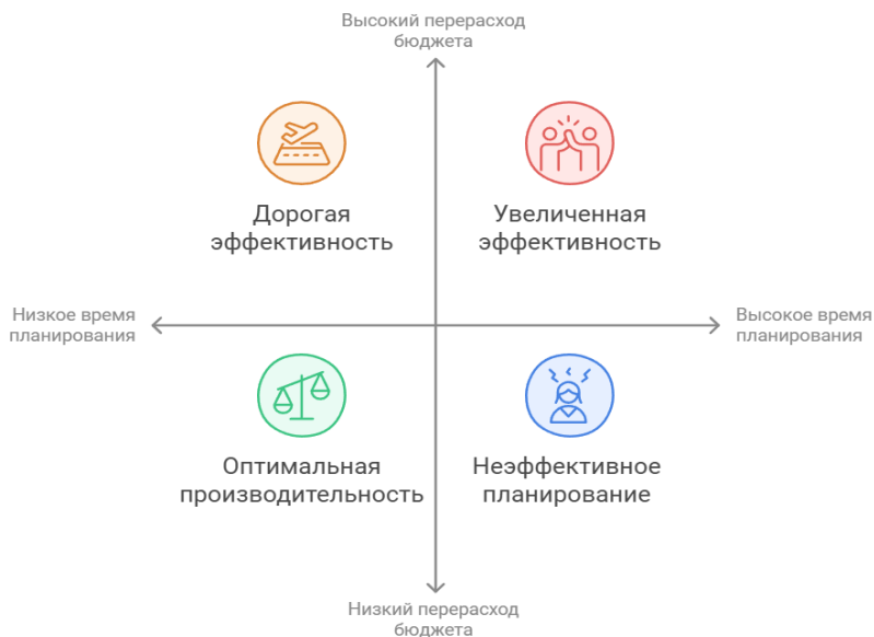
Рисунок 2. Влияние внедрения BI на ключевые показатели

BI-системы (рис. 1) позволяют в режиме реального времени отслеживать ключевые показатели эффективности сотрудников. Это включает время, затраченное на выполнение задач, соотношение планового и фактического времени работы, количество выполненных задач. Например, если одна из строительных бригад систематически не укладывается в сроки, BI-система может сигнализировать об этом, что позволит оперативно принять меры [6]. BI-системы также используют исторические данные для прогнозирования потребностей в рабочей силе на каждом этапе проекта, необходимости привлечения дополнительных ресурсов и составления графиков работы для минимизации простоев. Например, система может рассчитать, сколько сотрудников потребуется для отделочных работ на объекте площадью 10 000 кв. м, исходя из сроков сдачи и доступных рабочих [4].