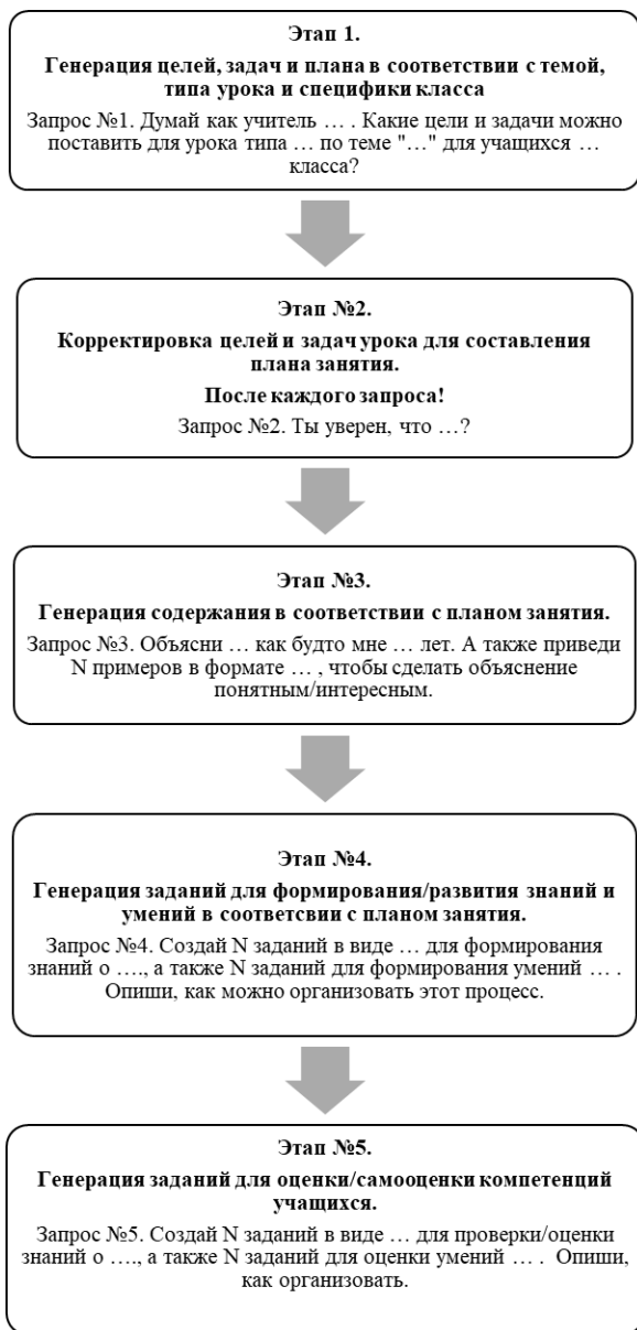
Рисунок 1. Последовательность проектирования урока с использованием ChatGPT