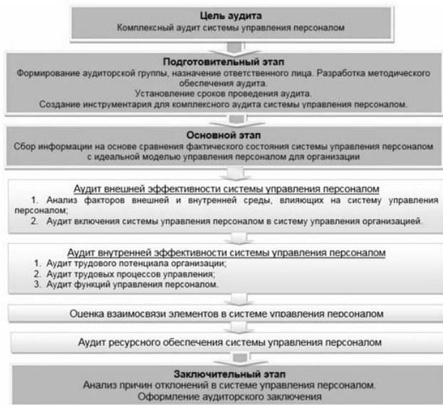
Рисунок 1. Технология осуществления аудита системы управления персоналом [1]

Ниже приведена заполненная таблица по первоначальному анализу работы с сотрудниками компании в части мотивации.