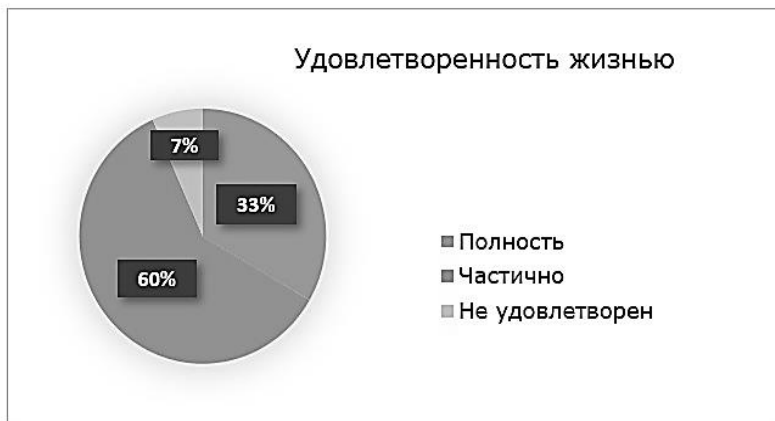
Рисунок 2. Удовлетворенность жизнью

Это означает, что тот, кто полностью удовлетворен жизнью, всегда достигал чего хотел, а тот, кто частично удовлетворен, также частично достигал чего хотел. Похожая зависимость и при ответах: «Если бы я мог прожить свою жизнь еще раз, я бы в ней», те, кто удовлетворены ничем не меняют, а те, кто не очень, что-то бы изменили.