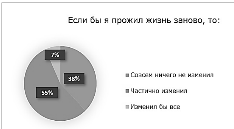
Рисунок 3. Отношение к жизни