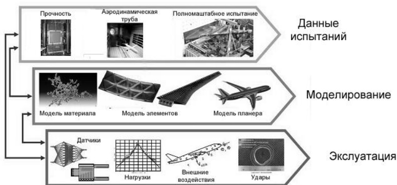
Рисунок 1. Единая информационная система

Разработанные методы SHM прошли достаточно успешную проверку применительно к контролю ответственных элементов различных строительных конструкций (силовые элементы высотных зданий, крепления мостов, и т. п.) и начали постепенно внедряться в авиации. Современные высокопрочные ПКМ имеют низкую трещиностойкость, поэтому при ударных воздействиях повреждения могут приводить к катастрофическому распространению невидимых трещин под воздействием усталостных нагрузок. Именно по этой причине особенно важны методы построения систем мониторинга, развитие которых с каждым годом значительно растет. На ВС ставится все больше датчиков, которые соединяются в едином информационном пространстве (Рисунок 1). Этот диагностический набор дает знания обо всем жизненном цикле.