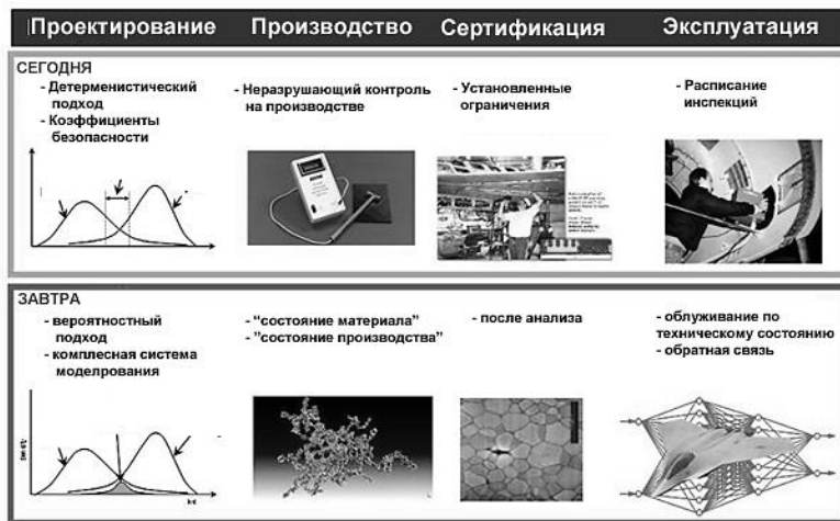
Рисунок 2. Тенденции использования системы мониторинга технического состояния

Существует два закладываемых при проектировании подхода, которые реализуют ресурсные показатели авиационных конструкций в эксплуатации – подход по безопасному ресурсу и по безопасному повреждению [1].