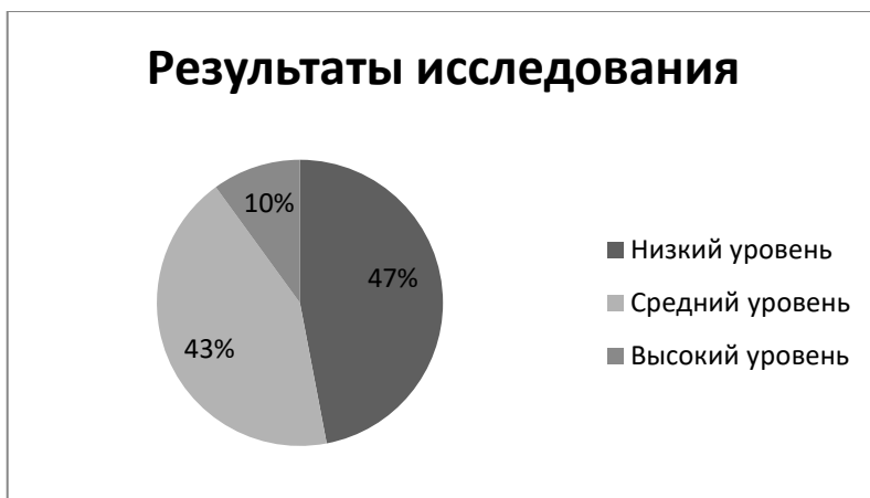
Рисунок 1. Исходный уровень сформированности навыков лексико-семантического анализа у детей 5-6 лет с общим недоразвитием речи (III уровень)

Высокий уровень сформированности навыков лексико-семантического анализа отмечен у 10 % детей. Дети с данным уровнем способны к быстрому поиску семантически подходящего слова, у них богат лексический запас. Следует отметить, что дети лучше справились с заданием, направленным на исследование номинативной функции существительных и глаголов. Редко встречались случаи названия «пальто» - «шубой», «прищепки» - «скрепкой», «трёт» - «готовит» (у 100% детей), «вяжет» - «шьёт», существительное «сито» не было названо. Результаты диагностики уровня сформированности навыков лексико-семантического анализа представим на рисунке 1.