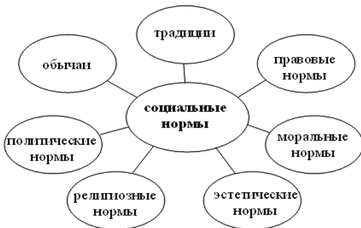
Рисунок 1. Классификация Социальных норм

Разберем подробнее, за что отвечает каждая социальная норма в современном обществе: