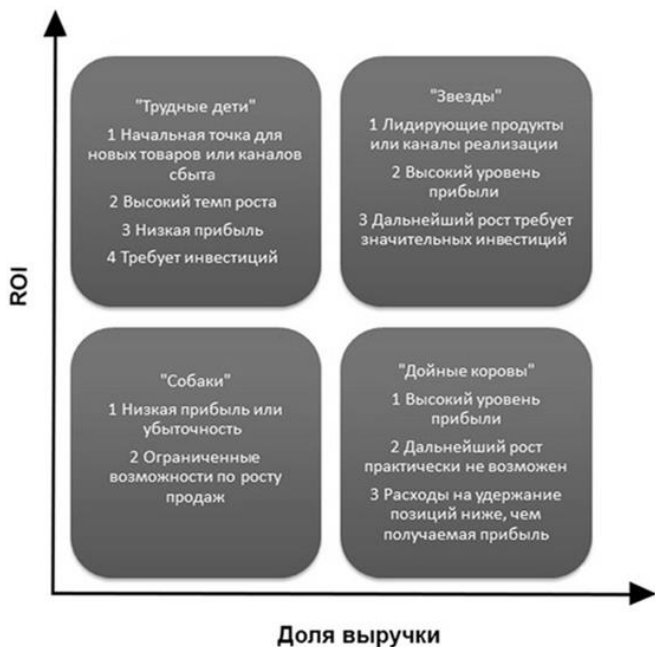
Рисунок 1. Матрица БКГ в электронной коммерции

Одним из наиболее популярных направлений, характеризующих ассортиментный состав продукции, является матрица ВКГ, которая позволяет выявить наиболее перспективные и, напротив, самые «слабые» продукты или подразделения предприятия. Построив матрицу БКГ, определяется «картина», на основе которой он может принять решение о том, какие ассортиментные группы стоит развивать, а какие ликвидировать [1].