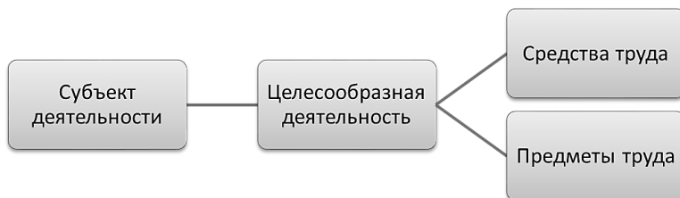
Рисунок 2. Структура трудового потенциала работника как проявления целесообразной деятельности

Оценка эффективности трудового потенциала и разработка направлений ее повышения носят специфические черты в зависимости от хозяйственно-экономического состояния организации, целей, задач, методов управления трудовым коллективом.