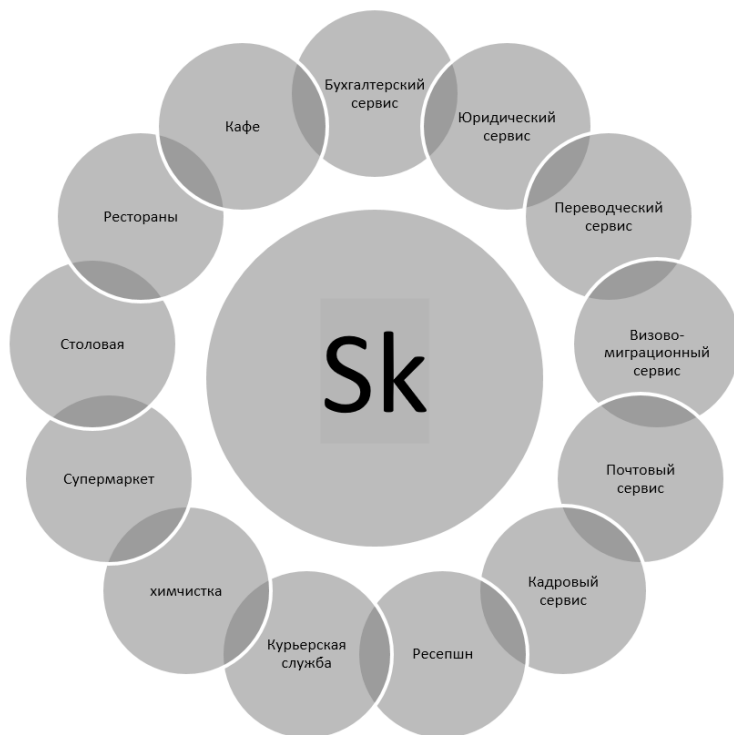
Рисунок 3. Структура и сервисы

Развиваются инновационные инфраструктуры: акселерационные сервисы и бизнес-центры Технопарка «Сколково». На 2018 год в Технопарке представлены следующие сервисы и элементы инфраструктуры: