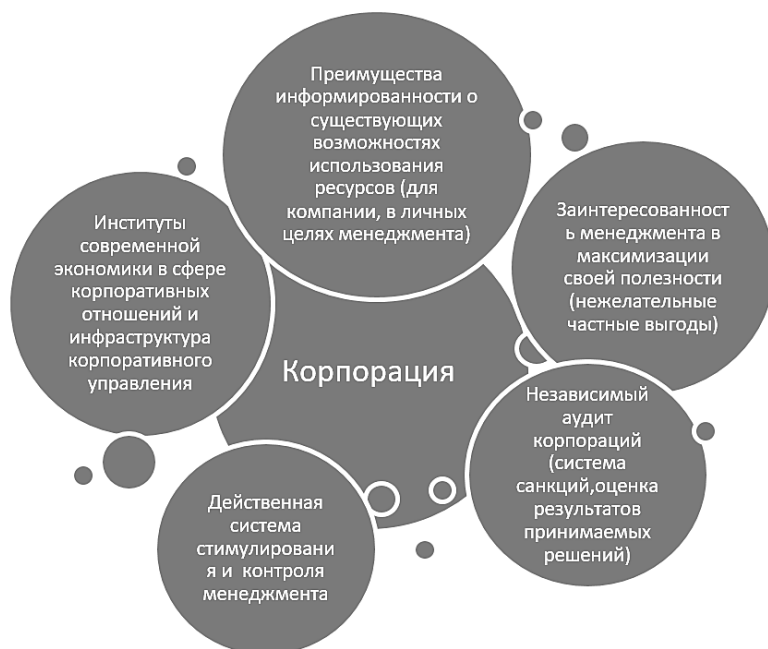
Рисунок 1. Факторы влияющие на функционирование корпораций

Существует ряд внешних и внутренних факторов оказывающих негативное или позитивное влияние на функционирование корпораций. (Рисунок 1)