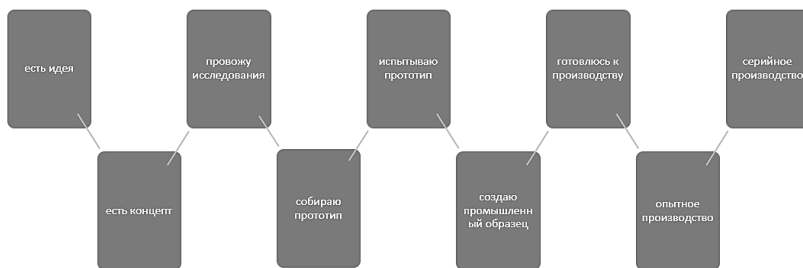
Рисунок 2. Онлайн-маркет-плейс услуг ЦПК

В 2018 году внедрен полноценный онлайн-маркет-плейс услуг ЦПК: