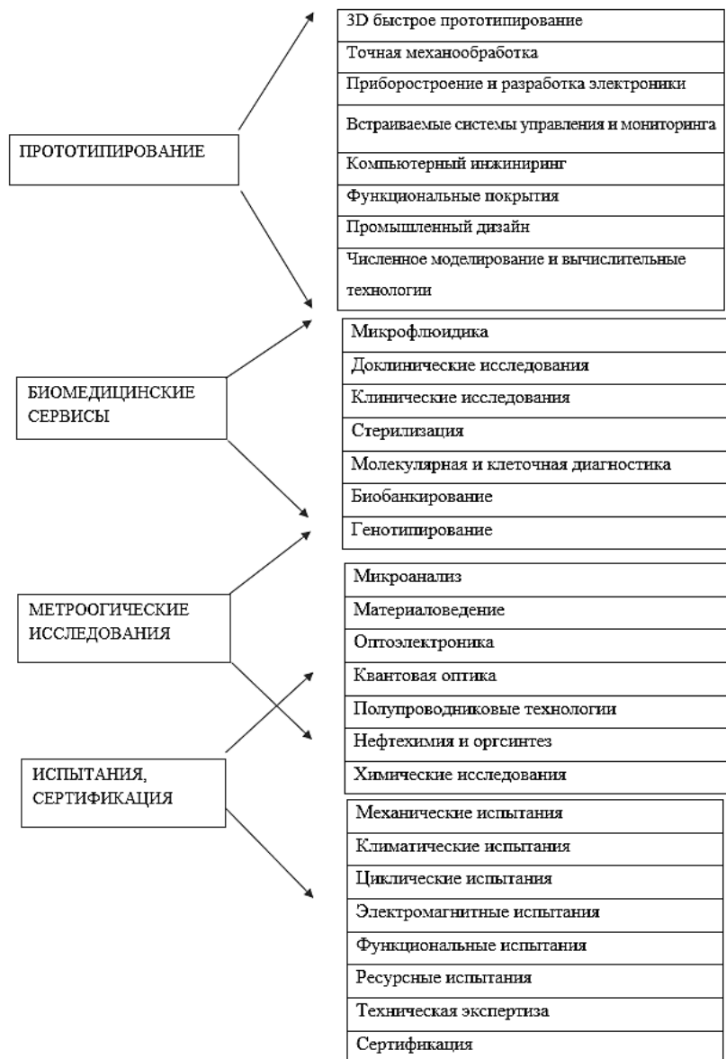
Рисунок 1. Основные направления работ Технопарка «Сколково»