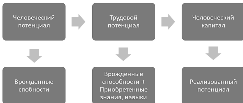
Рисунок 1. Взаимосвязь трудового потенциала и человеческого капитала

Взаимосвязь трудового потенциала и человеческого капитала схематически представим на рисунке 1.