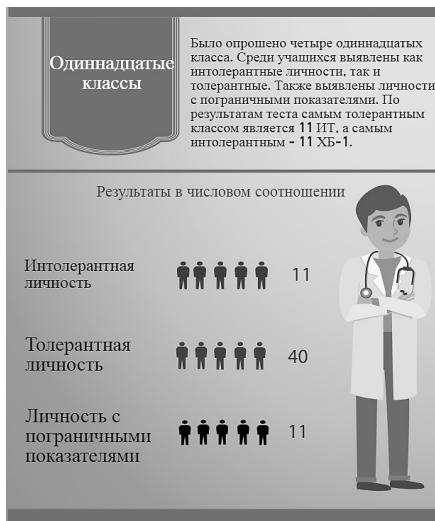
Рисунок 5. Соотношение толерантных/интолерантных обучающихся 11-х классов

Полученные данные красноречиво говорят о низком уровне толерантности среди опрошенных. Но нашей целью было не только выявление уровня интолерантности, но и проверка гипотезы о низкой самооценке интолерантных подростков. В опросник, разработанный нами, был включен пункт «Другие люди (лучше, хуже, ничем не отличаются от меня)». Ниже результаты ответа на этот пункт опросника: