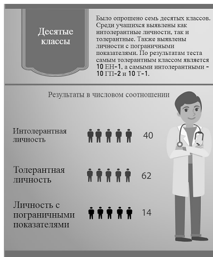
Рисунок 4. Соотношение толерантных/интолерантных обучающихся 10-х классов

Общая картина представляется следующим образом: