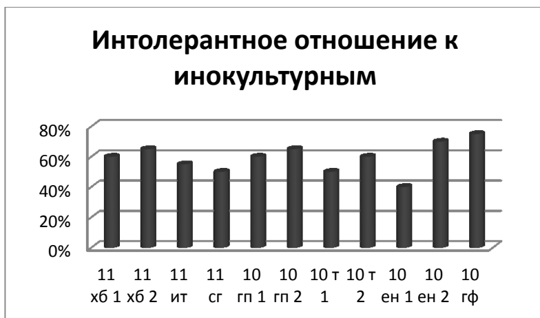
Рисунок 2. Результаты опроса по отношению к инокультурным