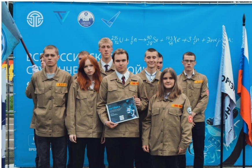
Рисунок 1. Студенческий отряд «Мы рядом»

На «целине» слово командира – закон. Мастер – его помощник на объекте. Целина – это наш летний трудовой семестр, который длится 2 месяца (июль, август), когда отряды выезжают на строительные объекты. Когда идешь в отряд, нужно понимать, что ты будешь в первую очередь работать. Но целина – это не только трудовые будни, но и праздники, и активная творческая деятельность. В отрядах это называют «комиссаркой», потому что именно комиссар не дает бойцам скучать в свободное время.