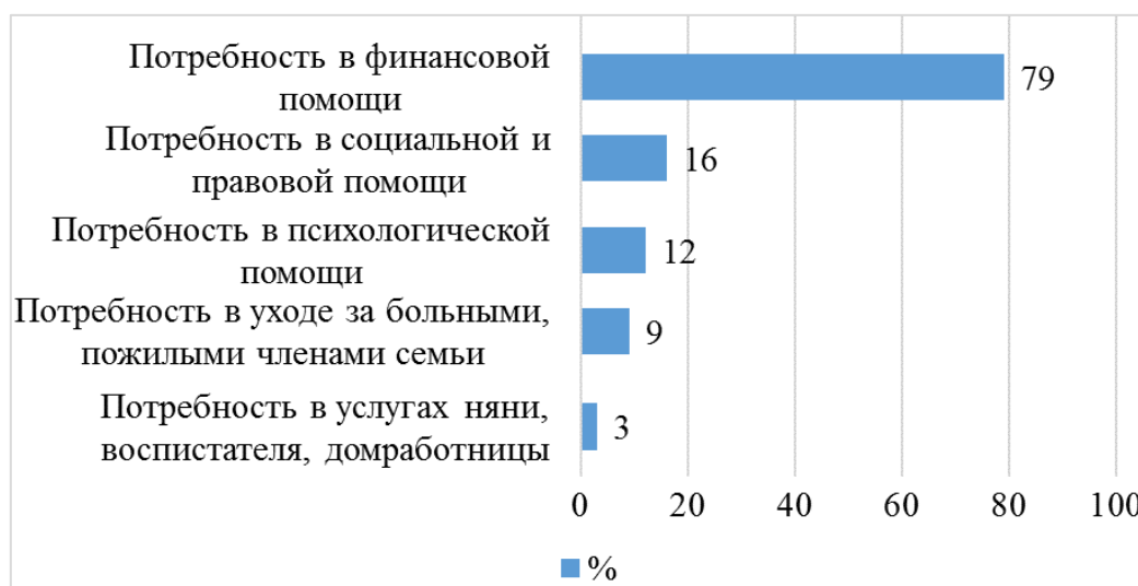
Рисунок 2. Результаты опроса о необходимых мерах социальной поддержки в МО г. Новый Уренгой

В рамках исследования, был проведен опрос респондентов из числа социально незащищенных групп населения города Новый Уренгой. В опросе приняли участие 162 человека. Основные направления социальной помощи, которые необходимы по мнению респондентов отражены на рисунке 2.