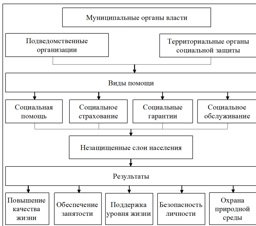
Рисунок 1. Система социальной защиты и социальной поддержки на уровне муниципального образования

В муниципальном образовании город Новый Уренгой (далее – МО г. Новый Уренгой) функции по организации и функционирования системы социальной защиты населения возложены на Администрацию города и на ее профильное управление – Управление по труду и социальной защите населения Администрации г. Новый Уренгой (далее – Управление).