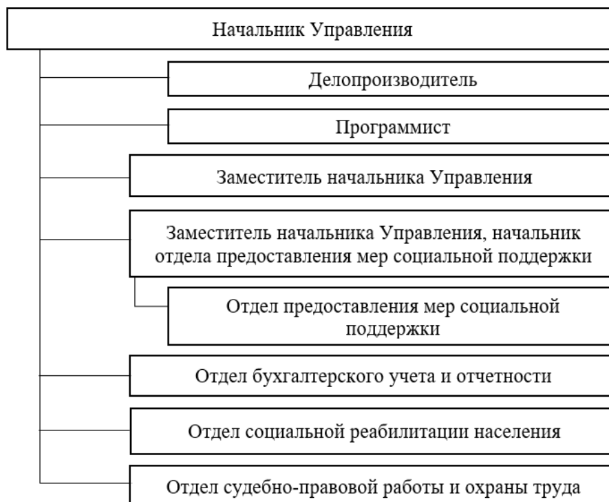
Рисунок 2. Организационная структура Управления по труду и социальной защите населения Администрации г. Новый Уренгой

На рисунке 2 представлена организационная структура Управления.