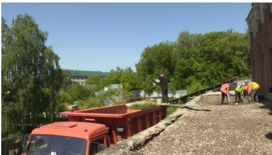
Рисунок 2. Подготовительные работы на реконструкции театра

Наше трудовое лето началось с реконструкции Кукольного театра в г.Костроме. Задачу привлечь начинающих специалистов к работам на социальных объектах региона поставил губернатор Костромской области Сергей Ситников. Капитальный ремонт здания включен в президентский национальный проект «Культура».