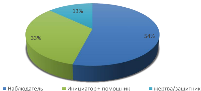
Рисунок 1. Процентное соотношение позиций, занимаемых в буллинге среди школьников

Результаты позиций занимаемых школьниками показаны на диаграмме (рис. 1).