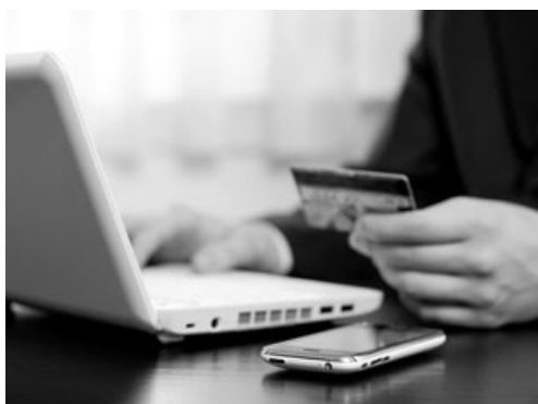
Рисунок 1. Онлайн банкинг

С внедрением в современные веб-приложения Web 2.0 и HTML5 требования клиентов изменились: они хотят иметь доступ к любым данным, которые им нужны двадцать четыре на семь. Такие требования подталкивают предприятия к тому, чтобы сделать эти данные доступными через интернет. Прекрасным примером этого являются онлайн-банкинг (рис. 1) и интернет-магазины (рис. 2).