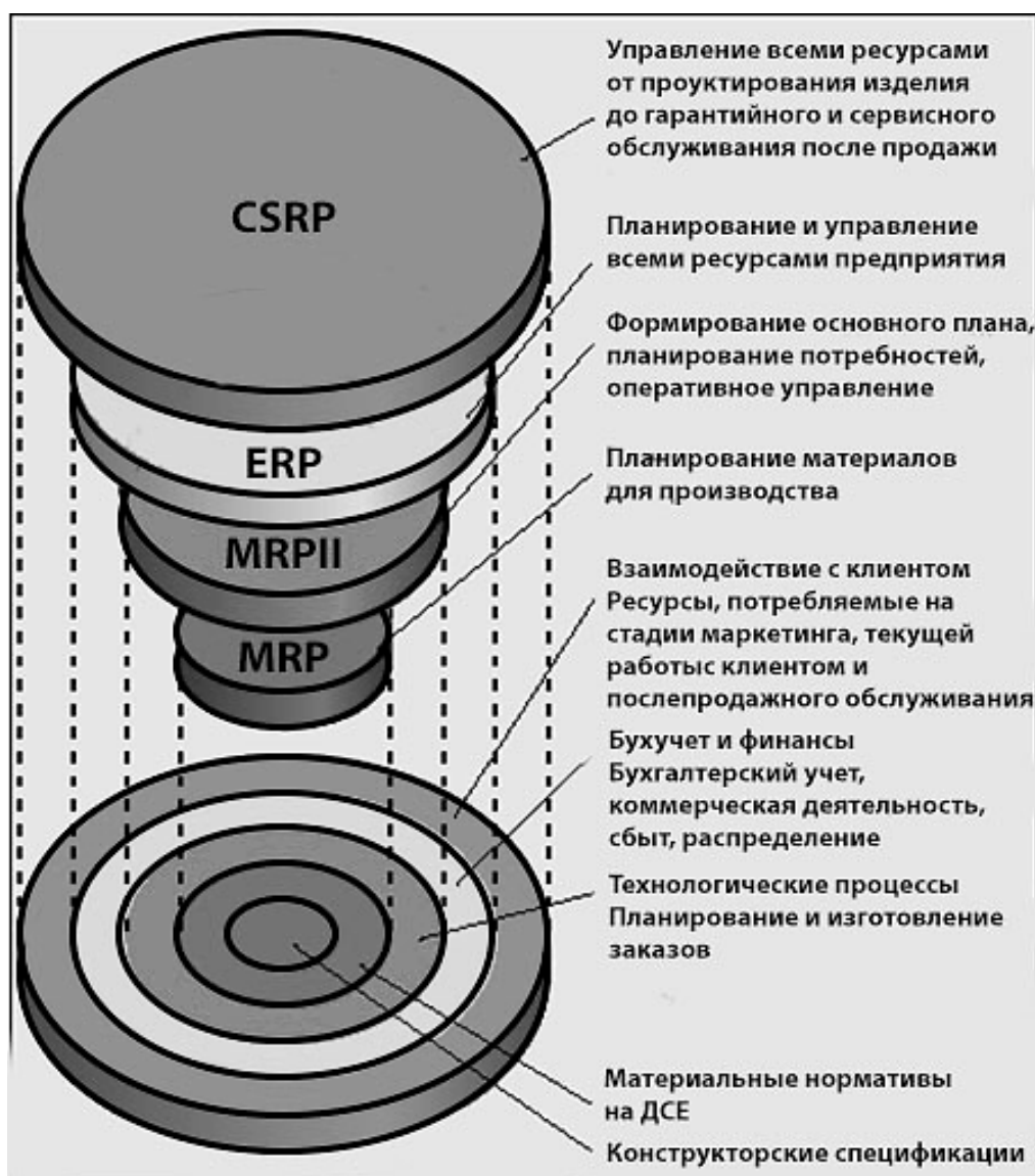
Рисунок 1. Схема эволюционирования методов: MRP, MRP II, ERP, CSRP

Метод MRP (Material Requirement Planning) – планирование материальных потребностей. С помощью данного метода можно управлять производственным циклом, начиная от поставки сырья, заканчивая удовлетворением запросов потребителей. Метод MRP помогает решить такие вопросы, как: выбор процессов для реализации, последовательность их выполнения (с помощью алгоритмов). Эффективность данного метода также заключается в том, что он позволяет оптимизировать план поставок, снизить затраты на производство и, соответственно, повысить его эффективность.