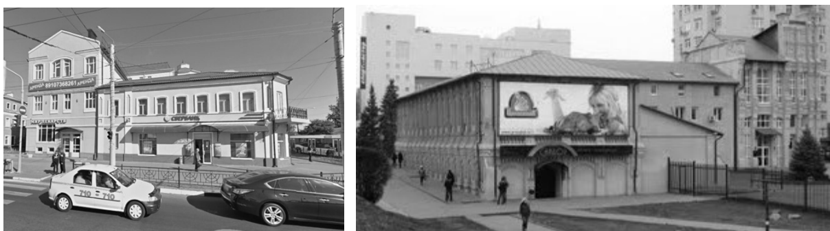
Рисунок 2. Нарушение ограничения в хозяйственной деятельности

Значительная доля (около 30 %) нарушений связана с размещением рекламы на объектах культурного наследия.