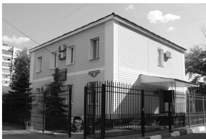
Рисунок 4. Жилой дом XIX в.

Выявлены и нарушения ограничение капитального ремонта и реконструкции