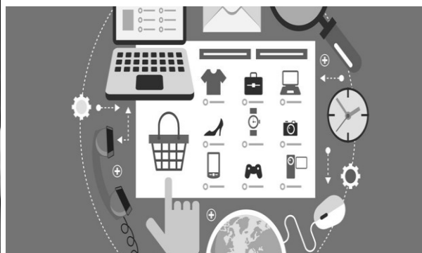
Рисунок 2. Интернет-магазин

Все эти улучшения также привлекают и хакеров, мошенников, потому что, как и в любой другой отрасли, деньги можно получить незаконно.