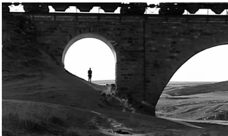
Рисунок 2. Кадр из фильма «Подарок Сталину»

«Жат» (2015) режиссера Ермека Турсунова. Действие картины происходит на небольшом пространстве, ограниченном отдаленным аулом в предгорьях и близлежащими горами и разворачивается вокруг Ильяса, который лишился семьи в ходе массовых репрессий и уединился отшельником в горах в пещере у родного аула. (Рис. 3) Пещера – полость сосредоточения, уходя «внутрь», в культуре восточных народов, человек получает некое духовное просветление, ответы на вопросы. Горы – сферы просветленного состояния земли и вещества. Эти два понятия – символы определенных душевных состояний, чувственно-зримый образ духовно преображенного мира, взаимосвязь которых выражается в процессе движения из пространства внешнего мира в пространство внутреннее - мифологема возвращения внутрь, ставшая фундаментальной характеристикой восточного мироощущения. Даже сам человек – существо объемное, обладающее внутренним пространством, в котором происходят движения, перемещения и изменения индивидуальности (пространства). Индивидуальность может быть незаполненной, чистой или пустотной, то есть несущностной, в то время как абсолютная заполненность не является позитивным фактором, так как пространству человека некуда продолжаться.