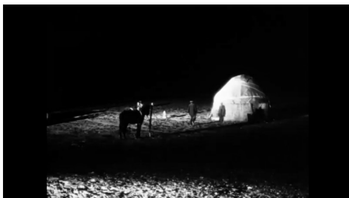
Рисунок 1. Кадр из фильма «Суржекей – ангел смерти»

Впрочем, отношения между людьми здесь такие же, как в любом мегаполисе: необходимый баланс любви-ненависти сохраняется в любом обществе. Так было до тех пор, пока в аул не явился представитель Советской власти, называющий себя Суржекеем. Полуграмотного кочевника, сына степей и пустынь отправили рубить собственный народ: страна остро нуждается в зерне, мясе, а превыше всего - в страхе и послушании. Нам не показывают тех,