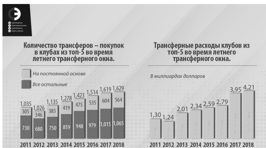
Рисунок 1. Динамика затрат на трансферы футбольных клубов Европы

На рисунке представлены количество трансферов и затрат на покупки игроков в клубах из топ-5 чемпионатов Европы во время летнего трансферного окна.