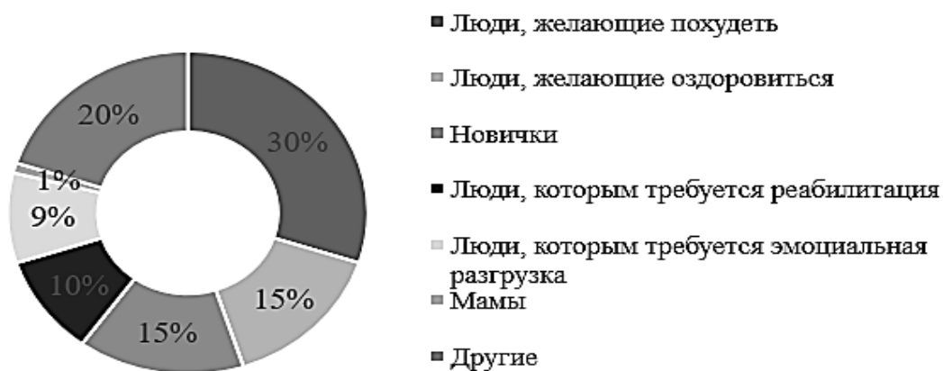
Рисунок. Структура целевой аудитории услуги фитнес-инструктора

Как видно из рисунка, наиболее многочисленная целевая группа (30%) – это люди, которые стремятся похудеть. Это связано с тем, что сейчас многие хотят выглядеть привлекательно и стараются уделять внимание спорту. Второе место в рейтинге занимают те, кто хочет оздоровиться (15%). К данной целевой группе преимущественно относятся люди в возрасте, зачастую пенсионеры, которые часто приходят на тренировки по рекомендациям врачей. Такая же по численности категория людей – это новички (15%). Это связано с тем, что в наше время есть тренд к здоровому образу жизни, поэтому всё больше и больше людей приобщаются к нему. Четвёртая целевая группа – это те, кому необходимо восстановиться после травм (10%). Чаще всего это спортсмены, которые травмировались по тем или иным причинам. Следующая по численности группа – это те, кому требуется эмоциональная разгрузка (9%). Обычно это люди, которые устали от рутинных дел и приходят на тренировки ради положительных эмоций. Самая немногочисленная целевая группа – это мамы (1%). Они ставят перед собой цель – хороший внешний вид своего ребенка. Преимущественно сами мамы являются клиентами этого же фитнес клуба/так или иначе связаны со спортом и считают, что он необходим им детям. Другие 20% ЦА занимают менее многочисленные группы.