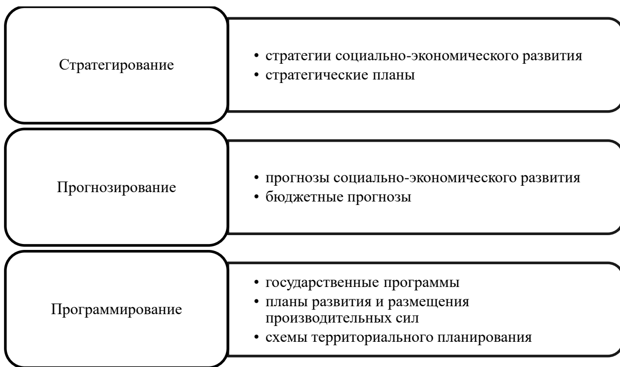
Рисунок 1. Механизмы и инструменты государственного регулирования социально-экономического развития

Одна из острых задач Правительства РФ на сегодняшний день – это создание условий по решению основных проблем неравномерного развития экономических систем регионов нашей страны, между которыми наблюдается сильное различие, как в социальных, так и в экономических показателях/индикаторах.