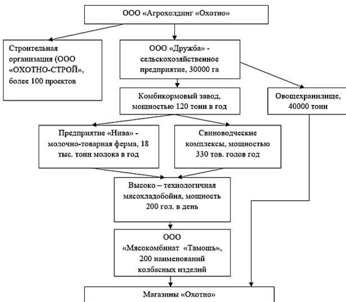
Рисунок 1. Инновационная инфраструктура ООО «Агрохолдинг «Охотно»

За 2021 год Агрохолдинг трижды вносил изменения в Уставный капитал Общества. 14.01.2021 – Уставный капитал повышен с 10 000 руб. до 160 778 000 руб. 28.04.2021 – Уставный капитал повышен с 160 778 000 руб. до 272 977 536 руб. 09.11.2021 – Уставный капитал повышен с 272 977 536 руб. до 583 240 186 руб. [9]. Вложения в основные средства выросли в 4 раза (табл.1).