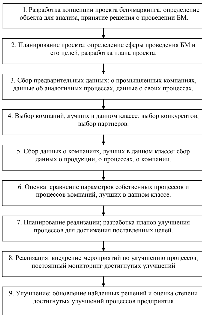
Рисунок 1. Основные этапы проведения типового проекта бенчмаркинга

Процесс бенчмаркинга обычно состоит из нескольких этапов (рисунок 1), начинающихся с планирования и заканчивающихся внедрением лучших практик в своей организации [1, с. 82].