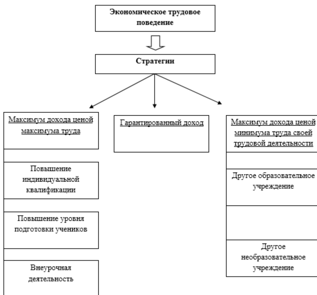
Рисунок 1. Стратегии повышения дохода в рамках НСОТ

Данная стратегия основывается на минимизации труда своей основной профессиональной деятельностью, но увеличение дохода за счет дополнительного заработка в других организациях. То есть, педагог минимизирует свою деятельность в рамках повышения заработной платы за счет стимулирующих выплат.