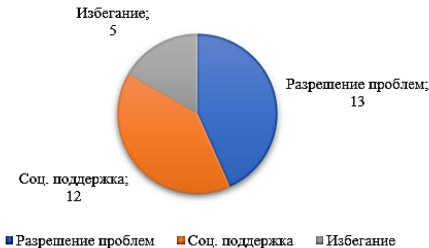
Рисунок 3. Распределение выборки по доминирующей копинг-стратегии

Результаты указывают на значительное преобладание у студентов – психологов активных поведенческих стратегий, что может быть связано с профилем обучения: информированность в психологическом знании влияет на осознанность поведения и выбора более эффективного варианта.