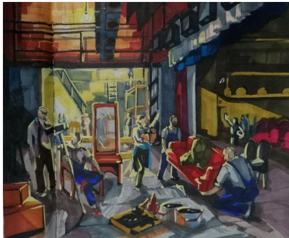
Рисунок 3. Работа в цвете

После успешного завершения работы над эскизом, мы определились с цветом и выполнили заливку. Была выбрана общая цветовая палитра. В процессе подбора оттенков света и тени, выявлялись главные фигуры и второстепенные. После того как определили самые освещенные фрагменты, и те, что уходят в тень, проработали первый план и главные фигуры, процесс завершается.