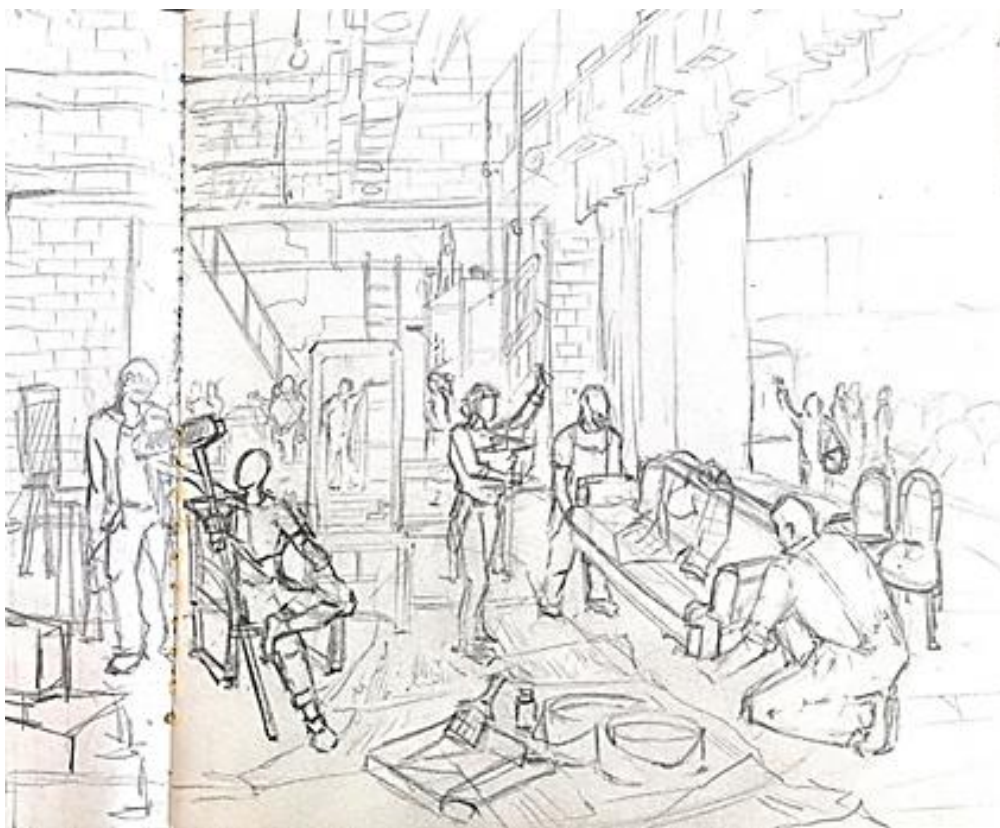
Рисунок 1. Эскиз

Для нашей работы «В театре» был выполнен эскиз, с учетом удачного расположением фигур, мы наметили плановость, определили и прорисовали главные фигуры и второстепенные. В процессе работы над эскизом изучались альбомы по пластической анатомии человека в статике и динамике, выполнялись наброски с натуры, зарисовки интерьерного пространства.