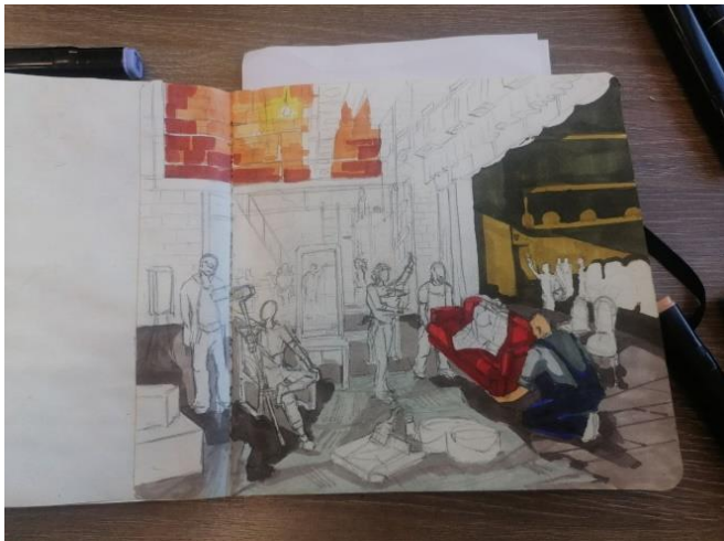
Рисунок 2. Выбор цветовой палитры

которые помогут уточнить тот или иной образ, ту или иную деталь. Так же целевое назначение наброска и живописного этюда состоит в том, чтобы запечатлеть конкретное, состояние природы ее характер и особенность» [1].