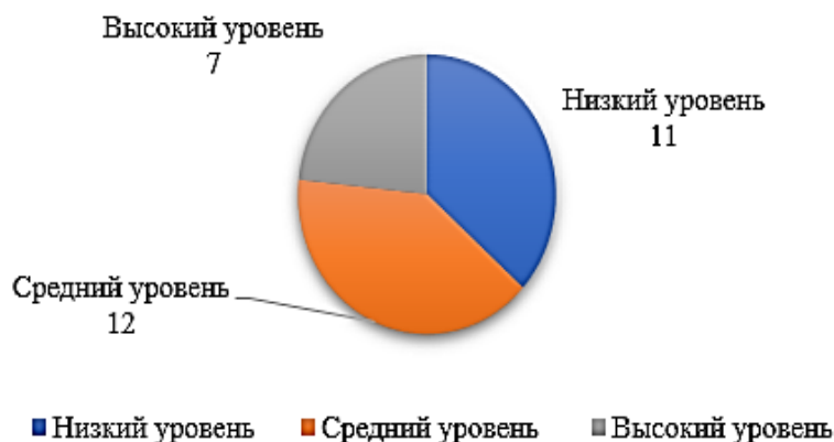
Рисунок 1. Распределение выборки по уровням толерантности к неопределённости