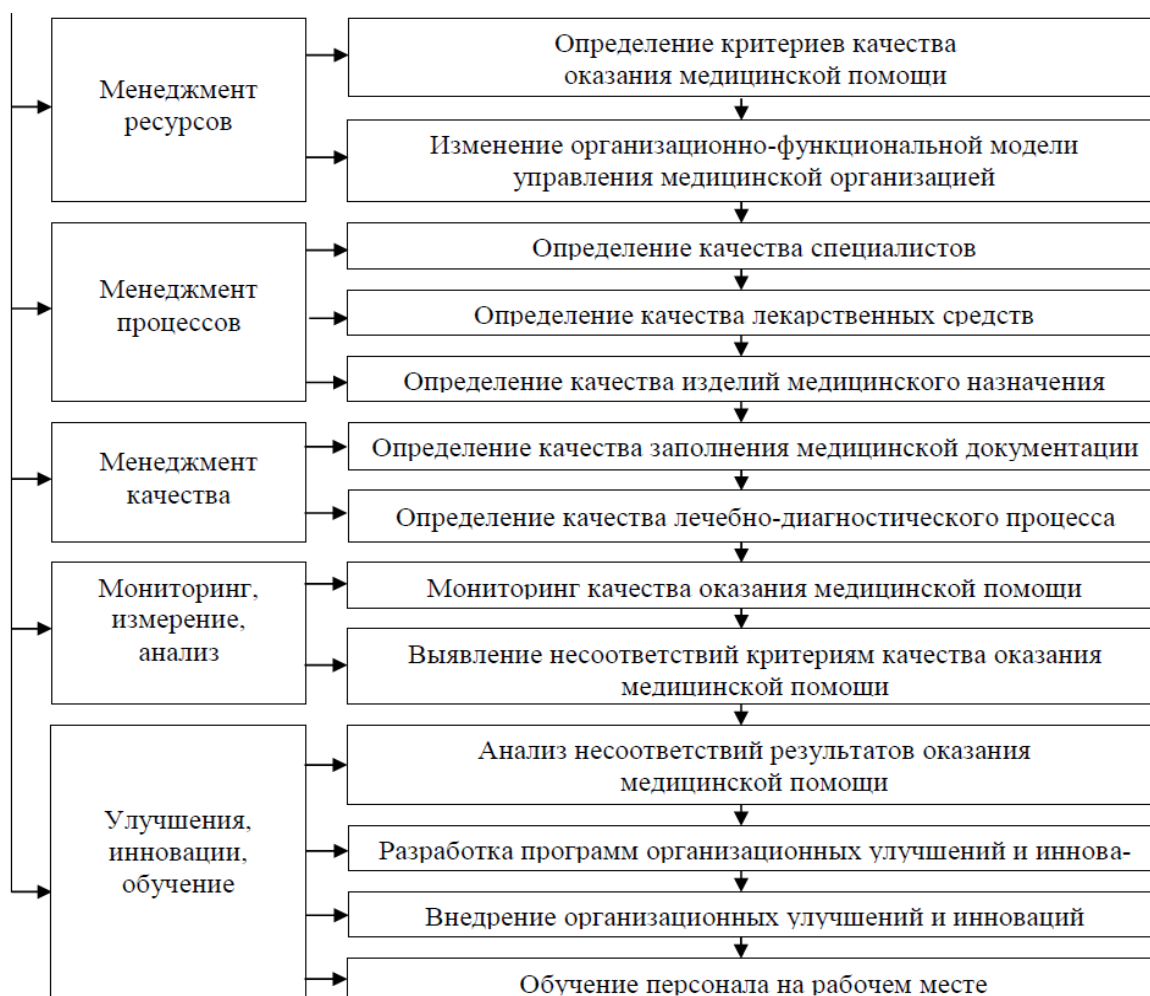
Рисунок 1. Интеграция модель направлений проектного подхода в медицине [3, с. 227]

проектного подхода и состоит в большей эффективности достижения конечной цели и решении проблемы [3, с. 228]. Проектный подход является воплощением идеи бережливого здравоохранения, что в условиях финансово-экономических, технологических, квалификационных, временных и других ограничений является жизненно необходимым на современном этапе. Он позволяет как поддержать уровень необходимого качества лечения и параметров состояния пациентов в требуемых нормах, так и высвободить ресурсы в целях улучшения качества лечения. Проектный подход является методом организации процессов, и его результатом являются осуществленные проекты, составляющие последовательную цепочку улучшений деятельности медицинской организации. Проектный подход охватывает все ключевые направления устойчивого развития организации (рис.1).