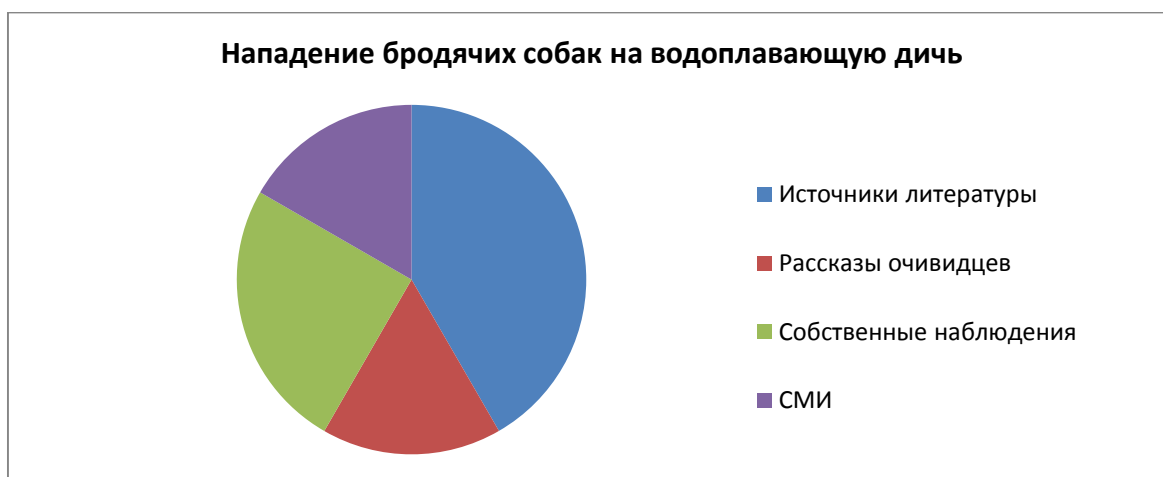
Рисунок 1. Нападение бродячих собак на водоплавающую дичь

По собранным материалам было известно о 5 источниках литературы, где говорится о нападении бродячих собак на уток. 2 нападения замечены при собственном наблюдении, по рассказам очевидцев о трех случаях нападения на водоплавающую дичь и 2 случая нападения на водоплавающую дичь в средствах массовой информации (СМИ).