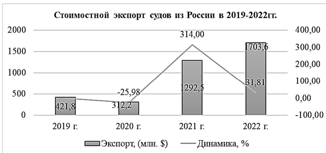
Рисунок 2. Статистика стоимостного экспорта судов из России [2]

К 2022 году экспорт судов в натуральном выражении сократился на 20,7%, или на 4,7 тыс. шт., такое снижение обусловлено падением экспорта в Казахстан мелкогабаритных, прогулочных и спортивных судов.