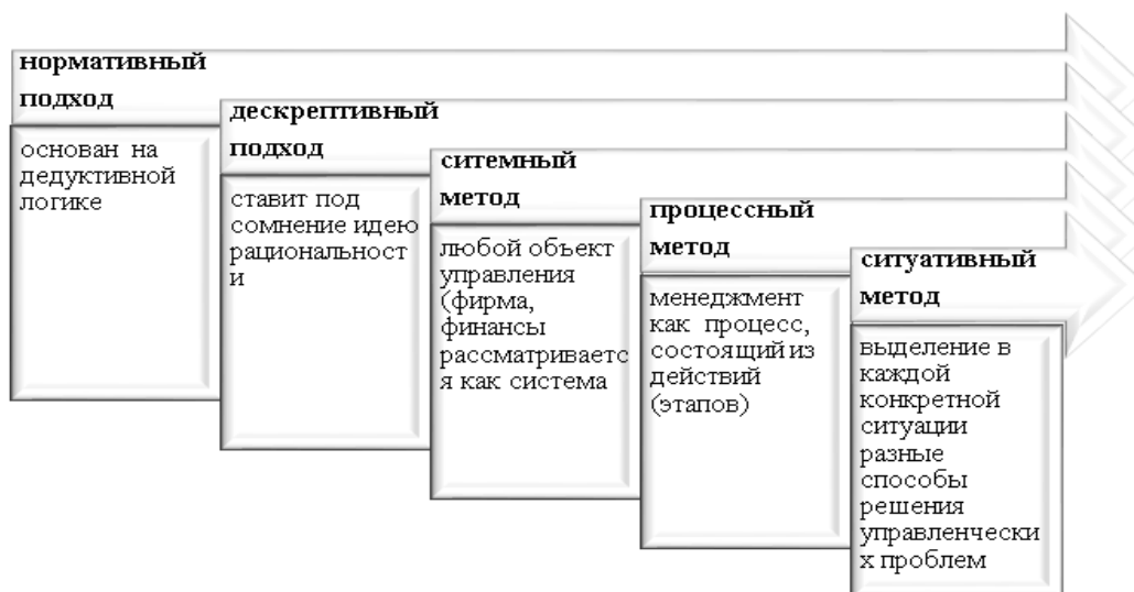
Рисунок 1. Подходы и методы к разработке управленческих решений

Мезенцева О.Е. [3, с. 59] отмечает основные подходы и методы к принятию управленческих решений, которые представлены на рисунке 1.