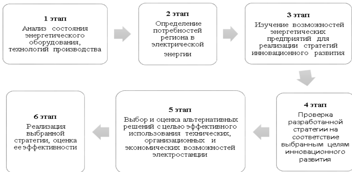
Рисунок 2. Этапы выбора конкретной стратегии инновационного развития на электроэнергетическом предприятии

Принятие конкретной стратегии инновационного развития в энергетической компании было представлено в виде процесса, состоящего из этапов, представленных на рисунке 2.