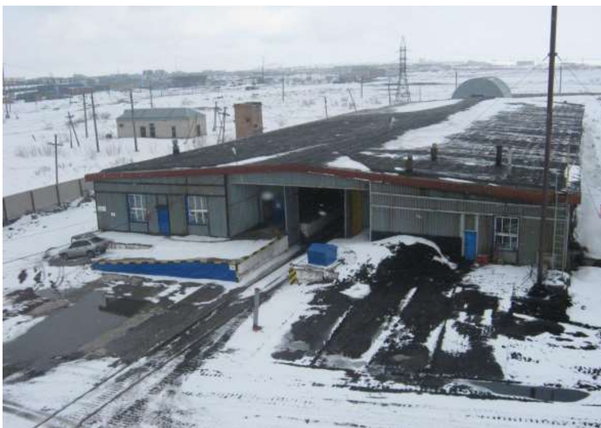
Рисунок 1. Главная кладовая

На время консервации основные объекты будут отключены от электричества, отопления, что снизит затраты по обслуживанию здания.