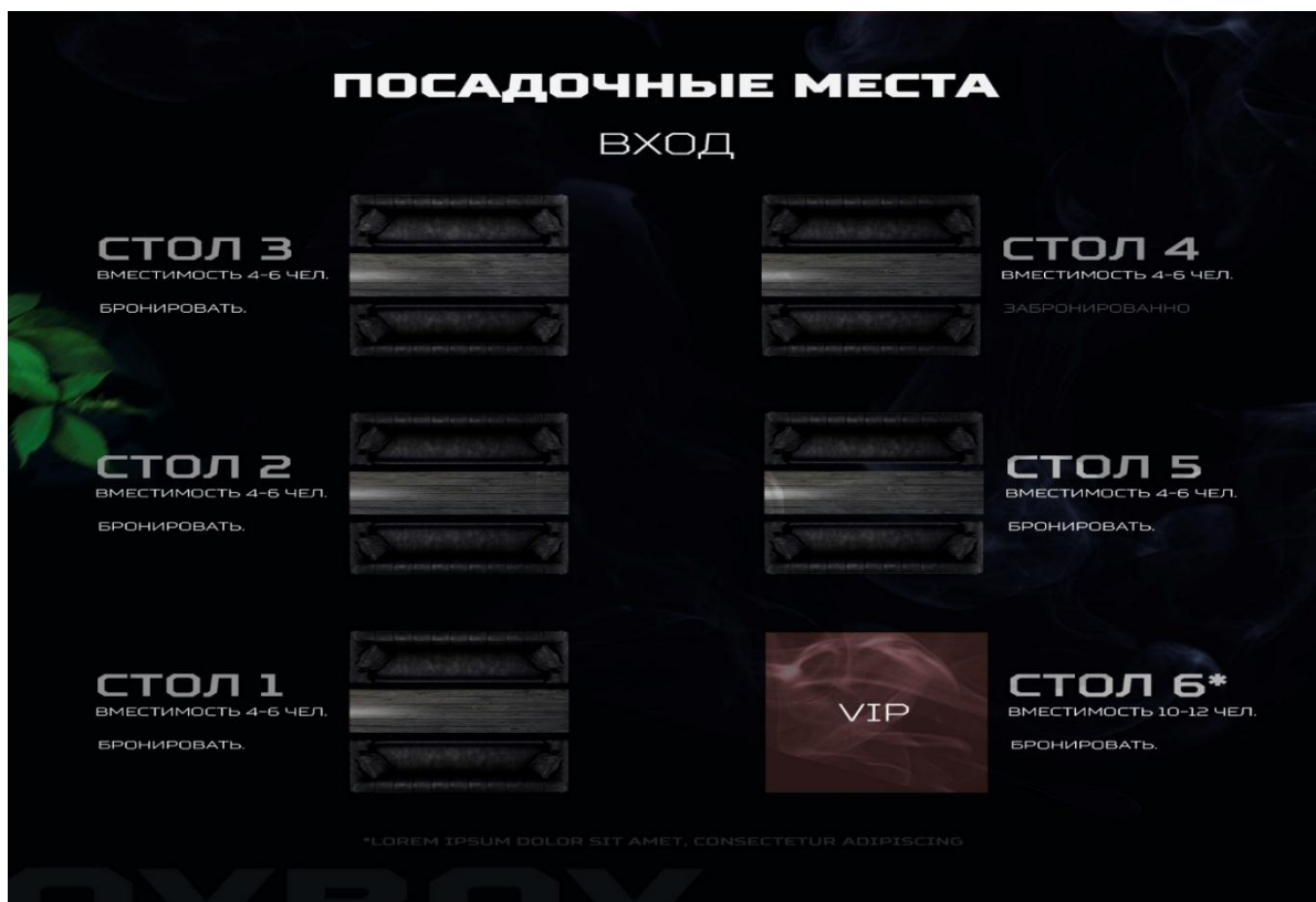
Рисунок 1. Реализация web-приложения