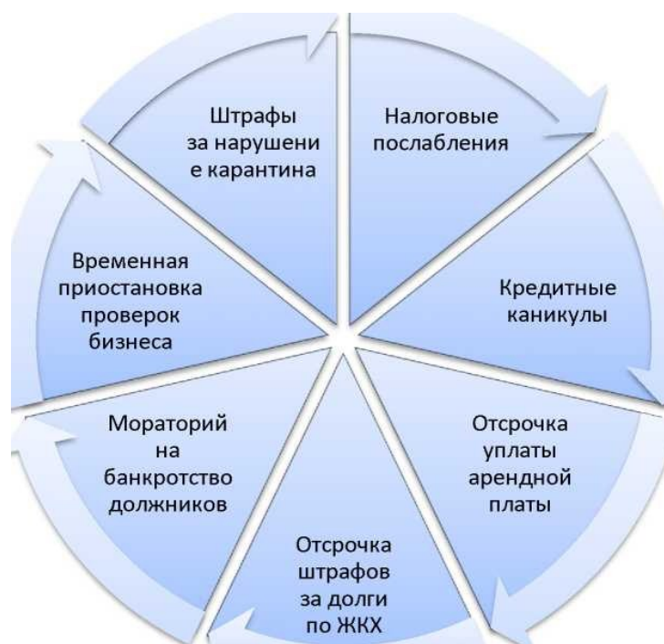
Рисунок 1. Изменения в законодательстве РФ и меры, принятые в связи с пандемией 2020г.

В-третьих, два раза снижены платежи в социальные фонды с 30% до 15%, но только для предприятий, в которых зарплата превышает МРОТ - 12130 рублей. Однако, для тех, у кого она ниже или на уровне, взносы остаются прежними [8].