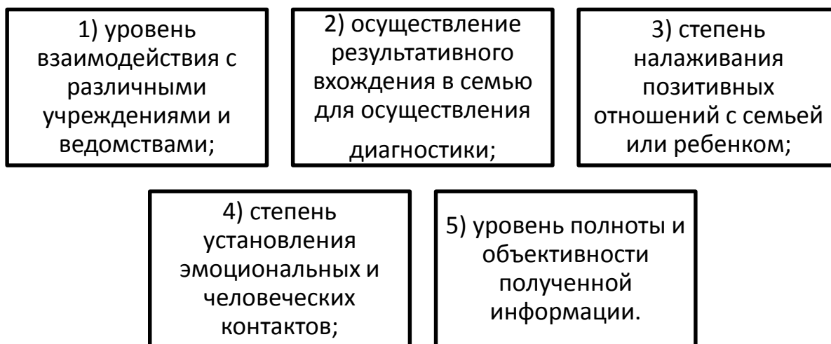
Рисунок 2. Критерии оценивания эффективности проведения

Таким образом получается, что социальная диагностика – это общая комплексная технология социальной работы, проникающая в самую суть проблемы клиентов социальных служб. Специалисты по социальной работе в любой отрасли должны работать согласно профессионально-этическому кодексу, владеть научными знаниями и навыками для проведения всех технологий социальной работы, в том числе и социальной диагностики.