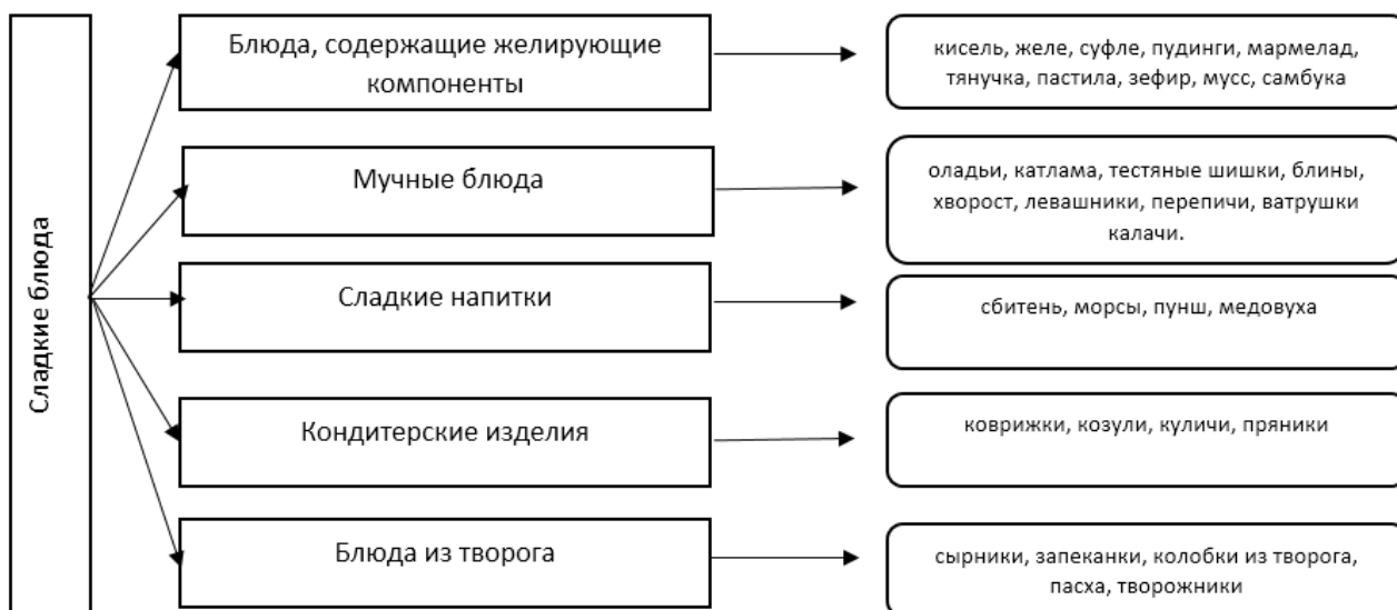
Рисунок 1. Классификация сладких блюд

Сладкие блюда можно поделить на группы, представленные на рисунке 1.