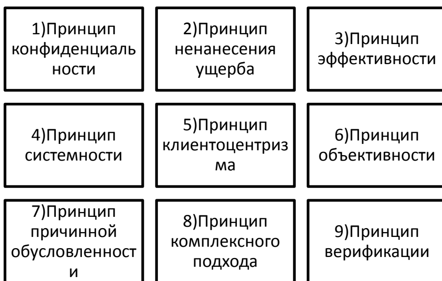
Рисунок 1. Принципы социальной диагностики

Целью социальной диагностики является получение полной и объективной информации о клиенте, систематизация полученной информации, её оформление для дальнейшего использования. Диагностика очень обширное понятие и меняется в зависимости от науки или метода рассмотрения.