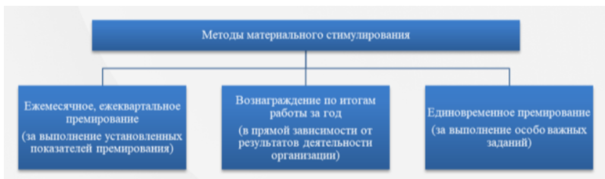
Рисунок 1. Распространенные методы материального стимулирования работников

6. Основной ценностью вознаграждения является стимулирование производительности и качества работы сотрудников компании, ориентация на достижение стратегических целей, то есть сочетание основных интересов сотрудников со стратегическими целями организации. Этот параметр определяет цели системы материального стимулирования. В современной системе материального стимулирования работников наиболее популярные методы представлены на рисунке 1.