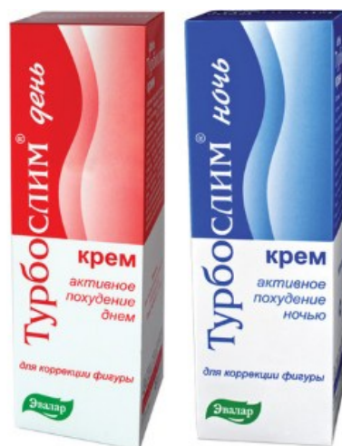
Рисунок 3. Очищающее средство

3) Сжигатели жира: Данную группу препаратов для похудения можно разделить на две подгруппы в зависимости от их действия. Первая подгруппа расщепляет жиры, поступающие в организм вместе с пищей, не давая им откладываться. Наиболее известными представителями этой группы препаратов являются препараты типа «Хитозана» (в состав которых входит хитин, получаемый из панцирей ракообразных). Препараты второй подгруппы — это сжигатели, или расщепители жира, уже имеющегося в организме. Чаще всего такие препараты производятся на основе бромелайна — фермента, выделяемого из ананаса, а также на основе травы гуараны южноамериканской.