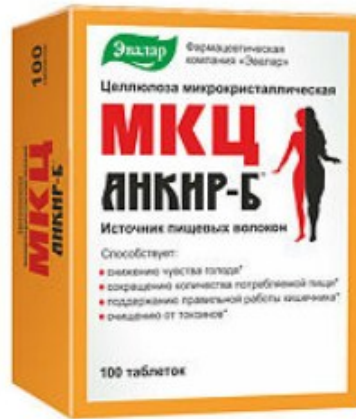
Рисунок 2. Пример балластного вещества

Полезное воздействие МКЦ на организм обусловлено наличием большого количества пищевых волокон и является довольно разносторонним. Среди свойств этого вещества специалисты отмечают значительное улучшение пищеварительных и обменных процессов и качественное очищение кишечника, выведение шлаков, токсинов, других продуктов распада. Происходит поглощение большого количества воды за счет высокой гигроскопичности вещества, нормализация уровня холестерина. Производится профилактика развития новообразований, том числе злокачественных, укрепление иммунитета, повышение энергии, активности, работоспособности.