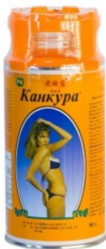
Рисунок 1. Пример балластного вещества

1) Балластные вещества — способны разбухать в желудке, создавая таким образом иллюзию насыщения и уменьшая количество пищи, съедаемой человеком. К балластным веществам можно отнести микрокристаллическую целлюлозу. Она входит в состав таких препаратов «Анكير-Б», выпускаемый ООО «Эвалар» и МКЦ-229 фирмы «Лавка жизни» и препараты серии «Нутрикон» («Арго»). Рассмотрим МКЦ-229 фирмы «Лавка жизни». Существует две фармацевтические формы, которые выпускают МКЦ (микрокристаллическая целлюлоза) – таблетки для похудения и порошок, используемый для снижения калорийности блюд. Как правило, микроцеллюлоза содержится в них в чистом виде, но некоторые производители выпускают такие препараты с различными полезными добавками – ламинарией, шиповником, солодкой, чагой и другими растительными компонентами.