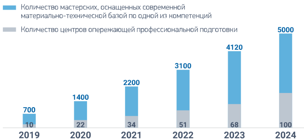
Рисунок 1. Диаграмма создания мастерских до 2024 года

В формировании нового ландшафта СПО станет улучшение инфраструктуры, материально-технической базы колледжей и техникумов, создание мастерских, соответствующих международным стандартам. Всего до 2024 года должно быть создано 5000 современных мастерских.