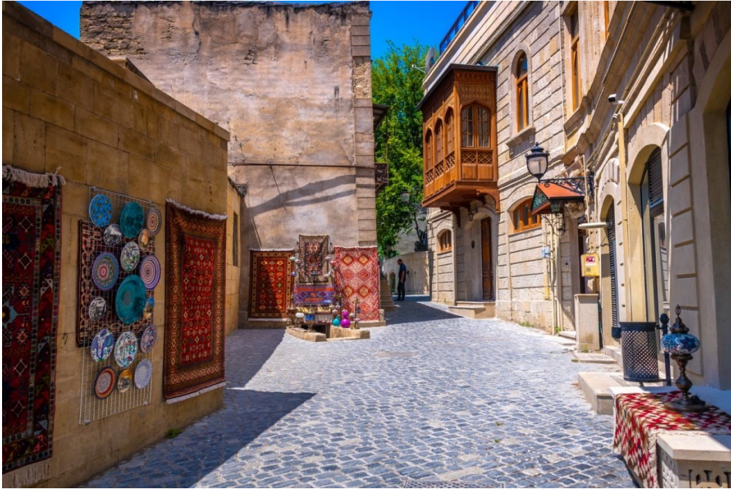
Рисунок 1. Ичері-шехёр (Внутренний город)