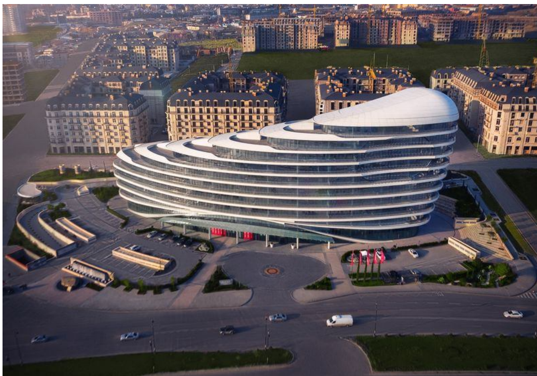
Рисунок 7. «Baku White City» (Белый Город Баку)