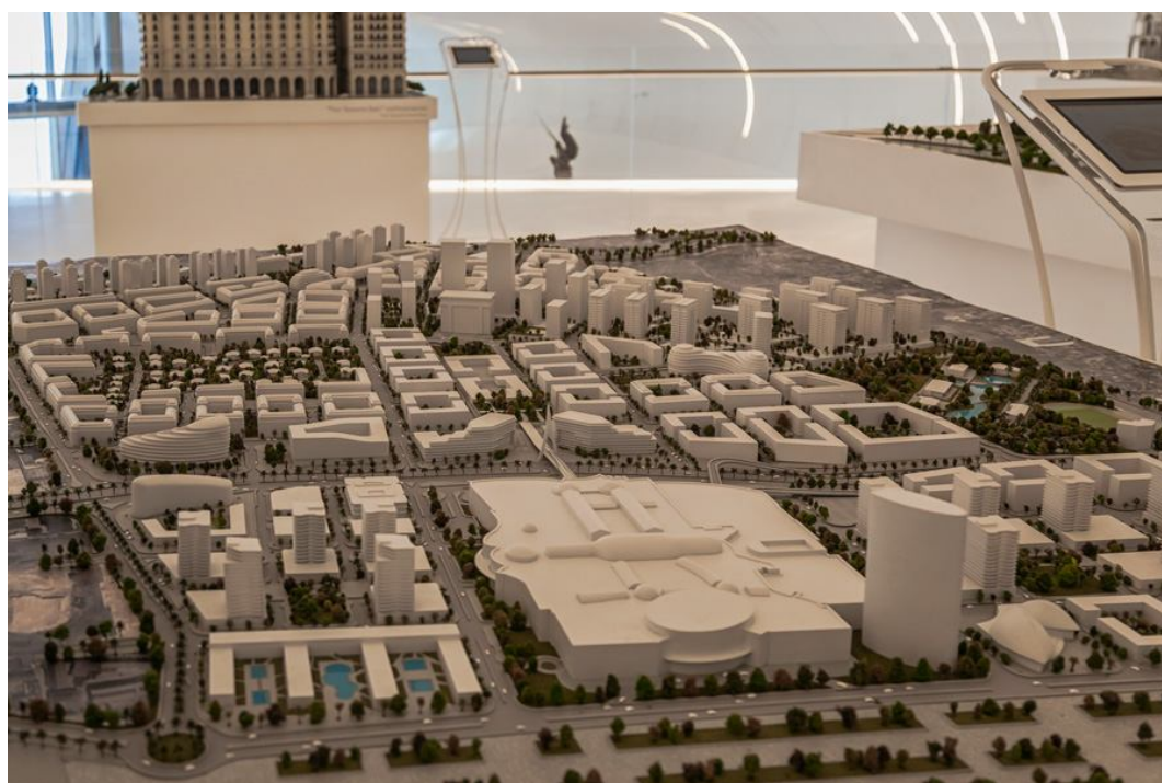
Рисунок 8. «Baku White City» (Белый Город Баку)

24 декабря 2016 года отмечалось 5 лет со дня закладки фундамента проекта Baku White City. Был сдан в эксплуатацию первый квартал Baku White City - Зеленый остров, состоящий из невысоких жилых зданий французского стиля.