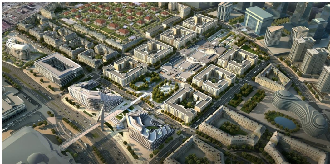
Рисунок 5. «Baku White City» (Белый Город Баку)

Основным принципом Baku White City является общественная, экономическая и экологическая целостность проекта.