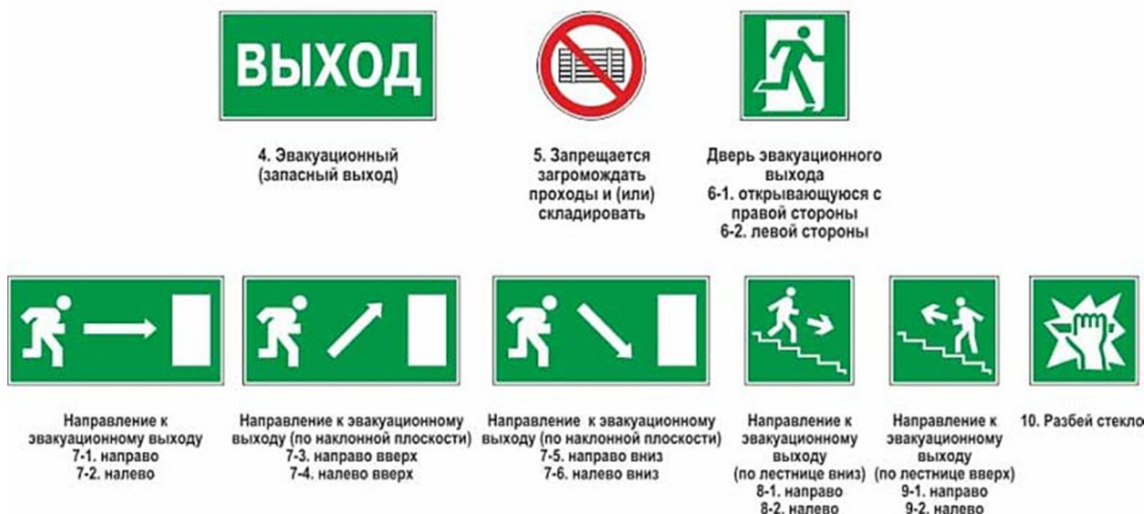
Рисунок. Знаки пожарной безопасности, используемые для обозначения путей эвакуации и эвакуационных выходов

В кинотеатрах все кресла должны быть хорошо зафиксированы и прикручены к полу. Также ковры должны быть прочно зафиксированы к полу и не быть из легкогорючих и токсичных материалов.