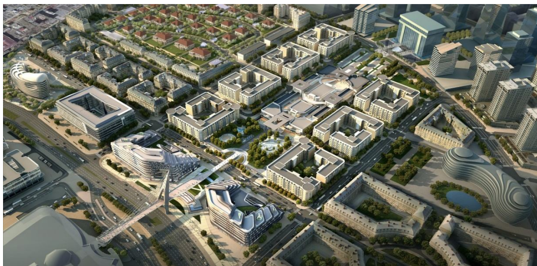
Рисунок 6. «Baku White City» (Белый Город Баку)