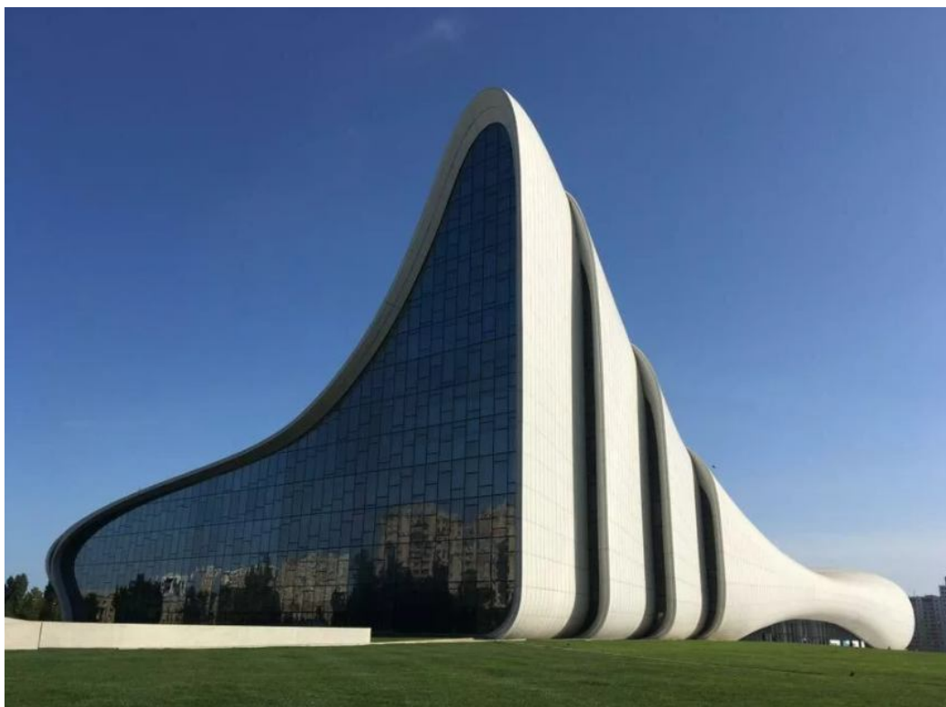
Рисунок 10. Культурный Центр Гейдара Алиева

Связь архитектуры и социально-экономических отношений тесно связаны друг с другом. Архитектура Баку не стоит на месте, она меняется, развивается с течением времени, но при этом не теряет свою оригинальность, удачно сочетая исторические здания и сооружения с современными комплексами.