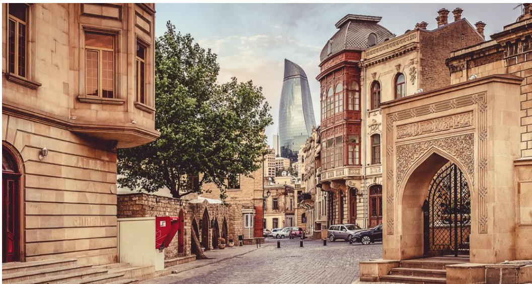
Рисунок 4. Ичері-шехёр (Внутренний город)