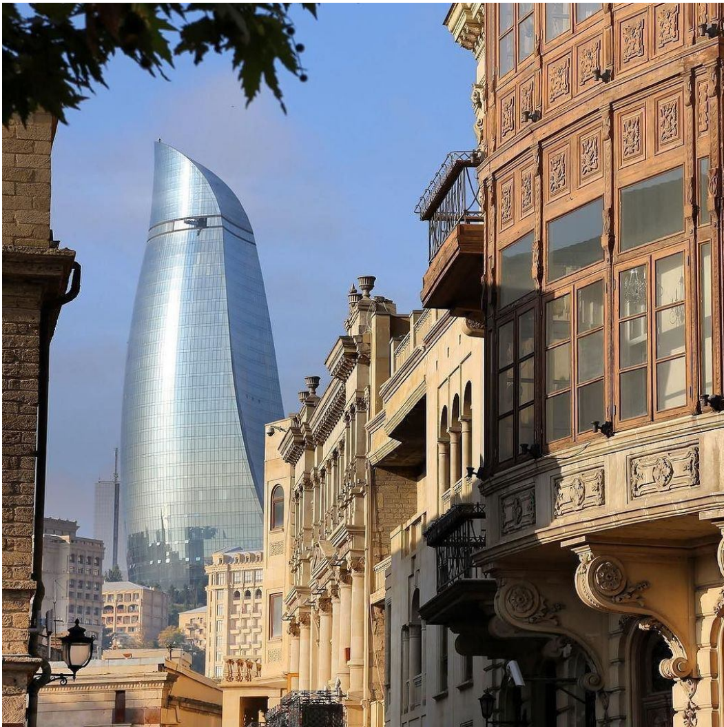
Рисунок 3. Ичері-шехёр (Внутренний город)