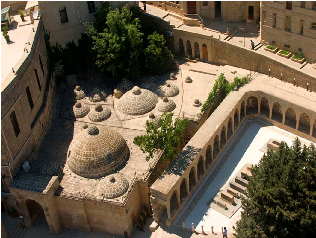
Рисунок 2. Ичері-шехёр (Внутренний город)