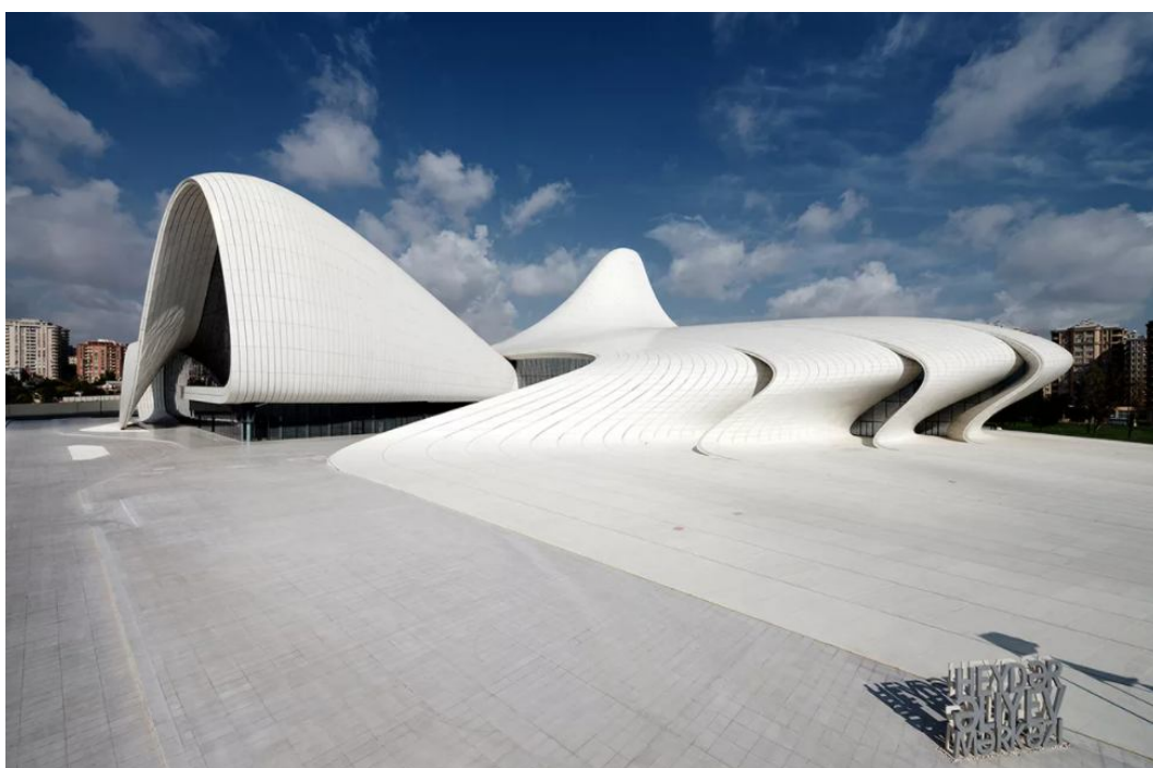
Рисунок 9. Культурный Центр Гейдара Алиева

В комплекс помимо здания центра входят подземная парковка и парк площадью 13,58 га. На территории комплекса имеются два декоративных пруда и искусственное озеро.